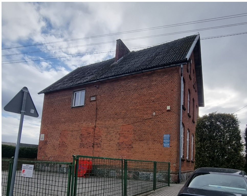
Fot. Obszar opracowania – widok ogólny.