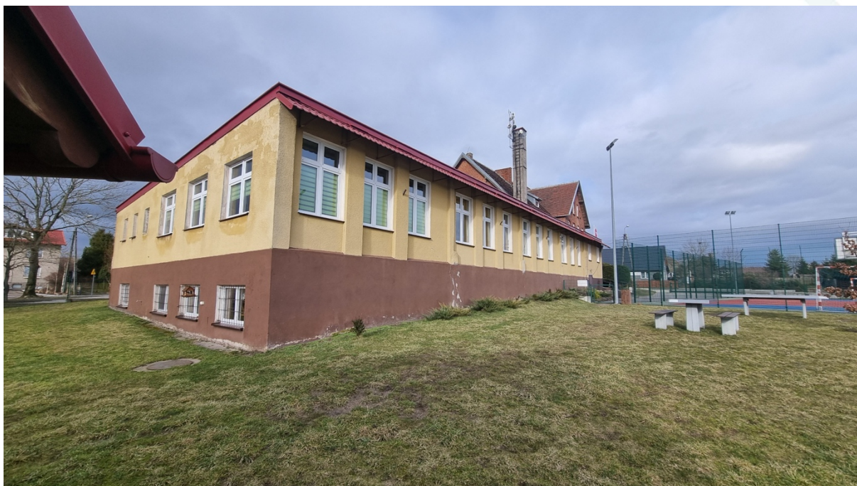
Fot. Obszar opracowania – widok ogólny.