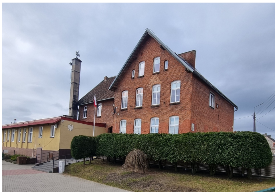
Fot. Obszar opracowania – widok ogólny.