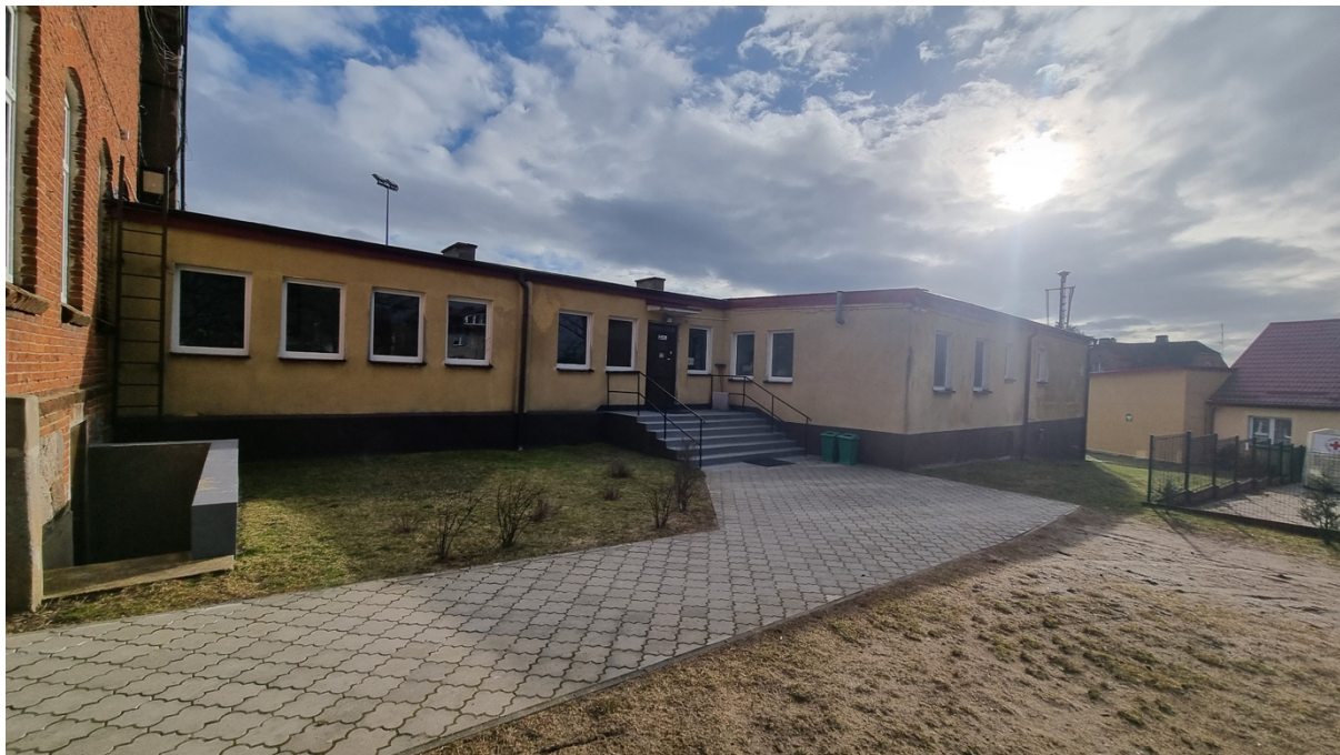
Fot. Obszar opracowania – widok ogólny.